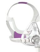
AirFit F20 for Her